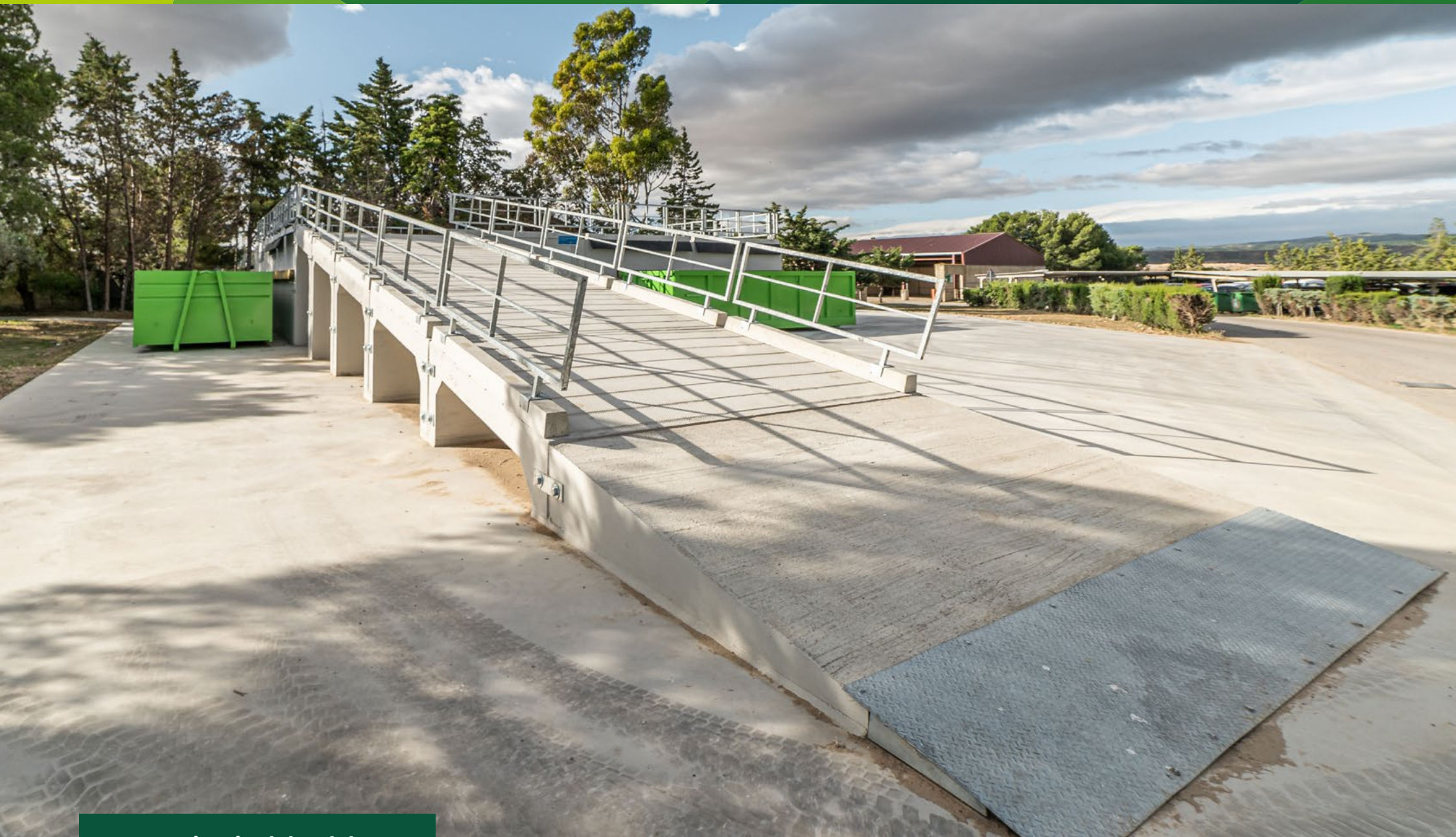
Punto Limpio del Culebrete