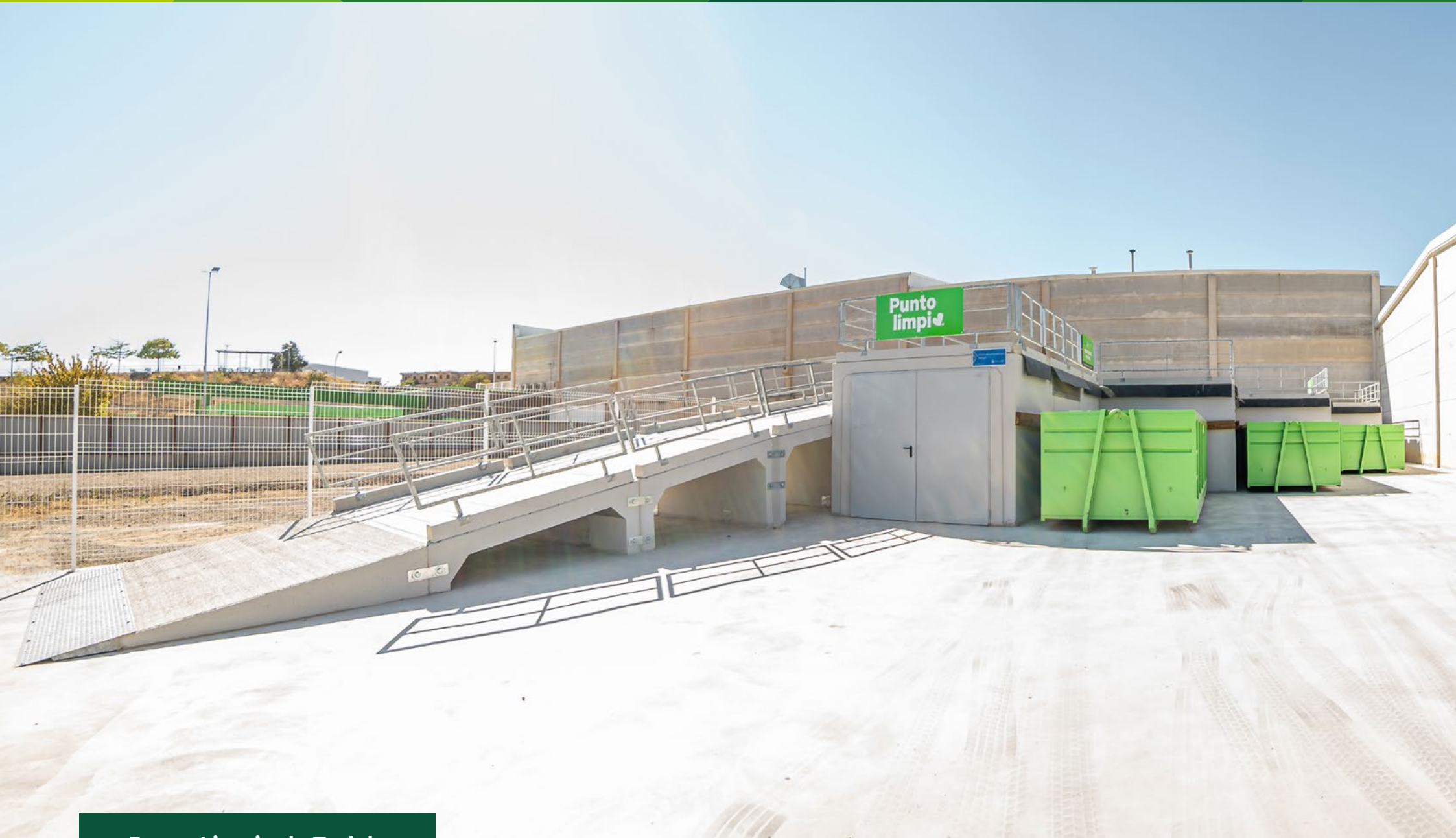
Punto Limpio de Tudela